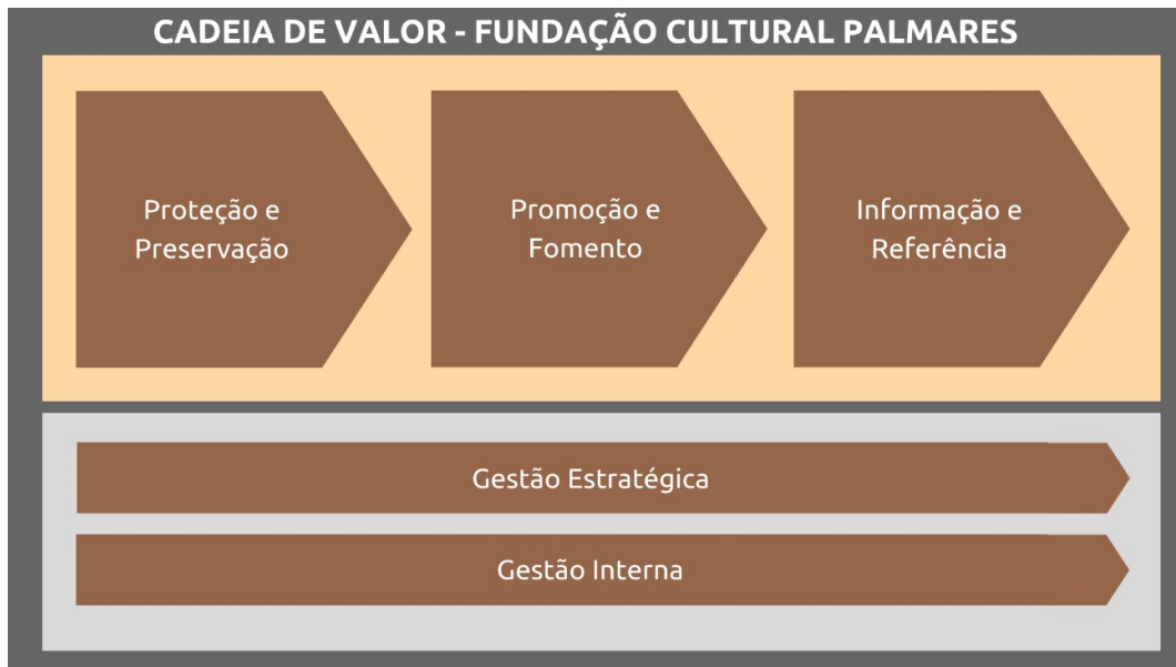
Figura 1. Cadeia de Valor da Fundação Cultural Palmares

A relação desses eixos de atuação é representada na Cadeia de Valor da FCP (Figura 1), estruturada em 5 macroprocessos, a saber: